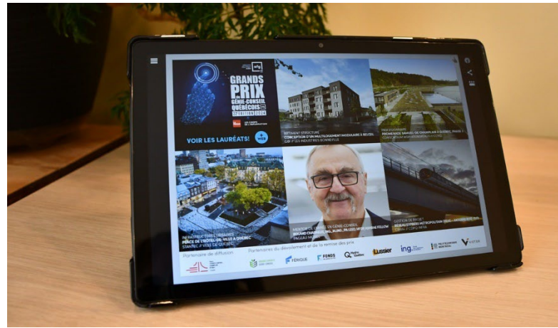
La Presse+, 24 septembre 2024