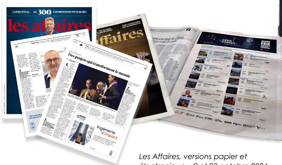
Les Affaires, versions papier et électronique – 9 et 23 octobre 2024