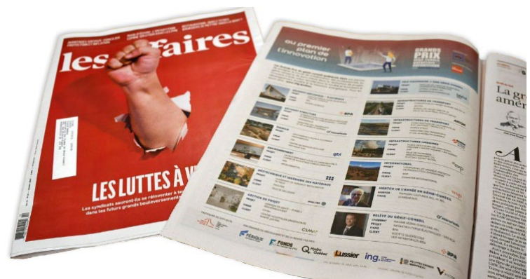
Les Affaires – Octobre 2023