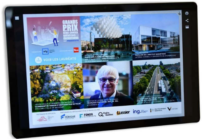
La Presse+ – 27 septembre 2023