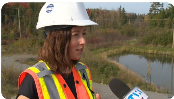
TVA – Octobre 2023