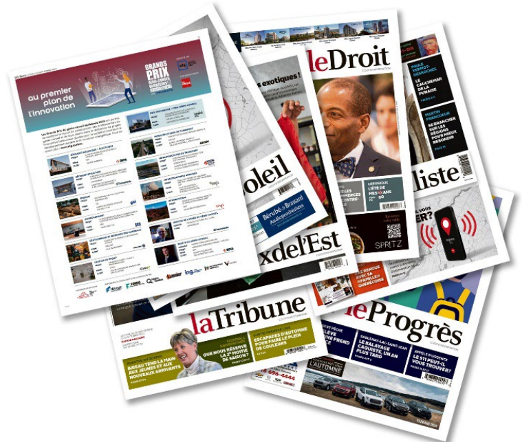
Réseau CNZi : Le Soleil, La Tribune, Le Nouvelliste, Le Droit, La Voix de l'Est, Le Quotidien/Progrès